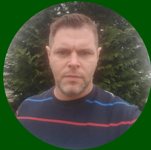
Matija Erhatic Association of Podravina Vegetable Producers