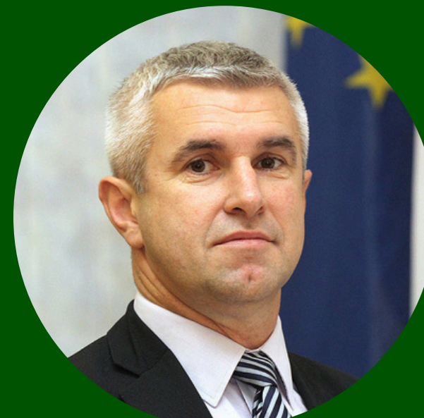
Tugomir Majdak Ministry of Agriculture, Forestry and Fisheries of the Republic of Croatia