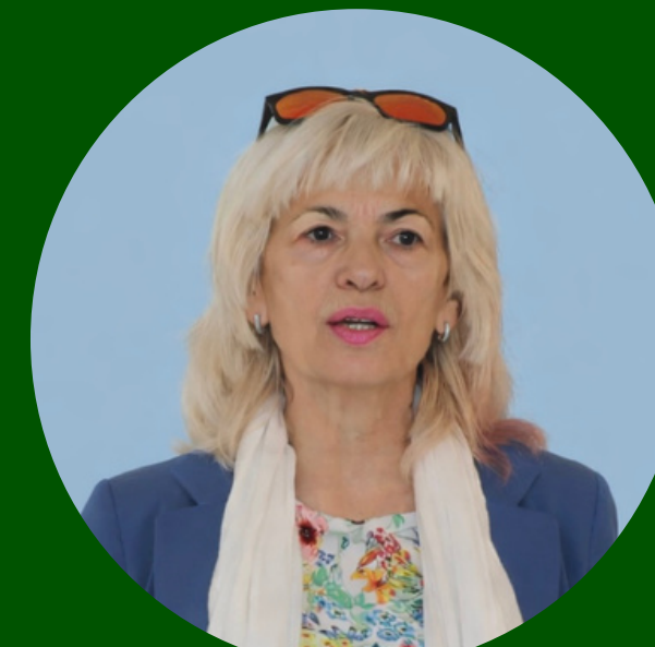
Jadranka Leško Ministry Economy of the Republic of Croatia