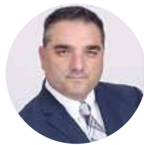
Hrvoje Bogdan Adizes Southeast Europe