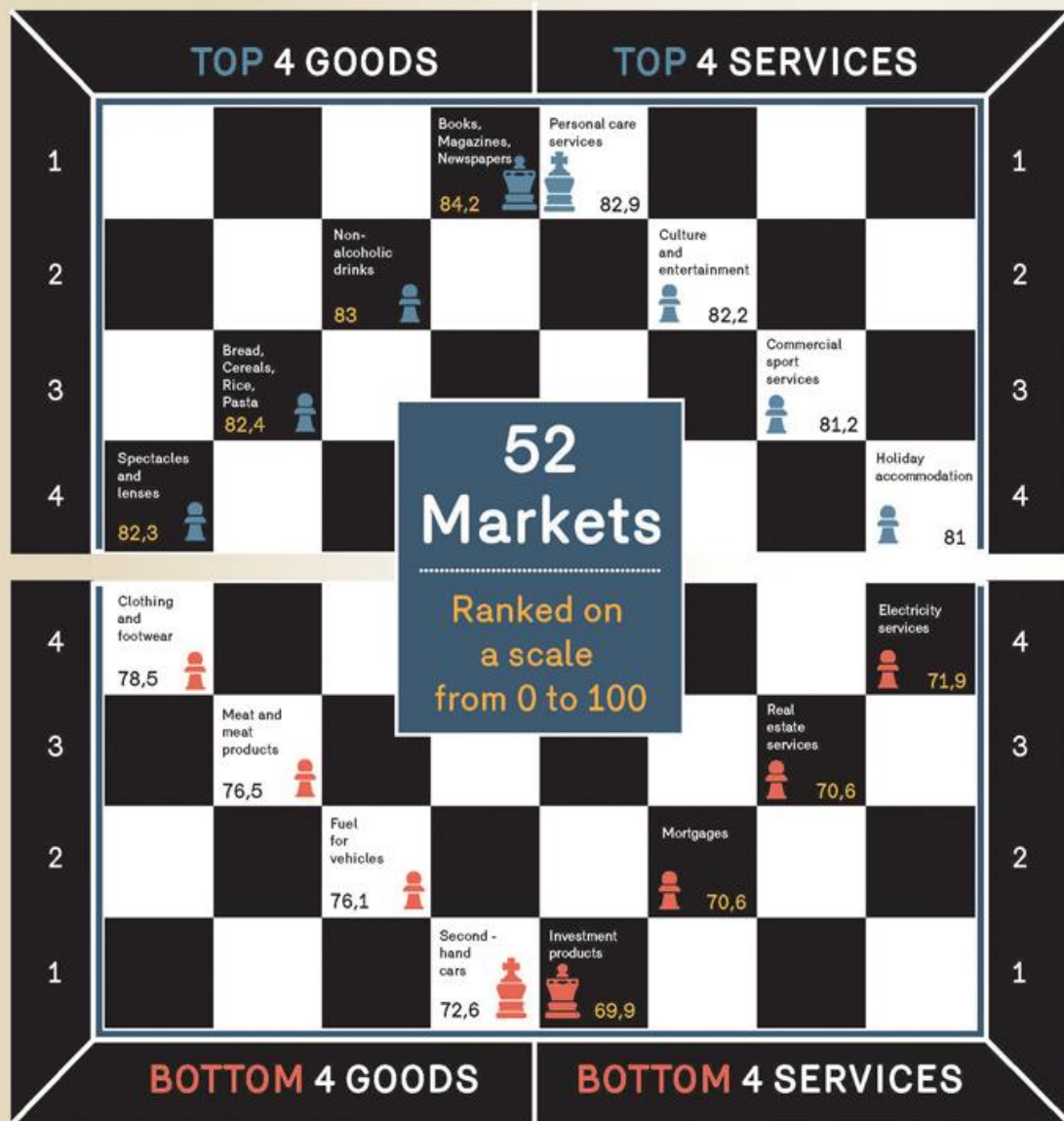
Figure out how MARKETS WORK FOR YOU