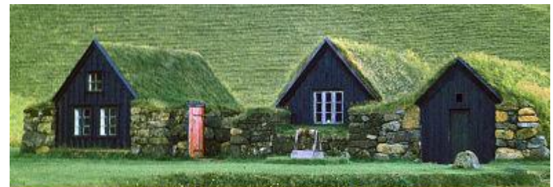
Eco-friendly homes for sale - Classifieds